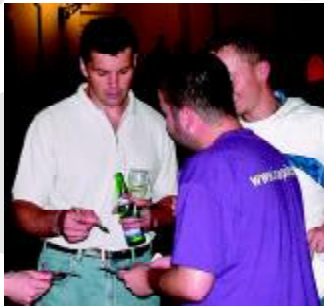
PILOTS-KAPITÄN FALK STAUDLER BEI DER VERTRAGS-UNTERZEICHNUNG DES JUNGEN TALENTS JAROMIR JAGR. GRUND DESSEN SCHLECHTER TRAININGS-LEISTUNGEN WURDE VON EINER VERPFLICHTUNG SPÄTER ABGESEHEN.