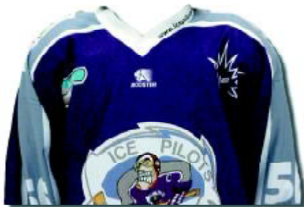
SPIELER-TRIKOT, BEFLOCKT (NUR AUF BESTELLUNG) ... 60,00 EUR